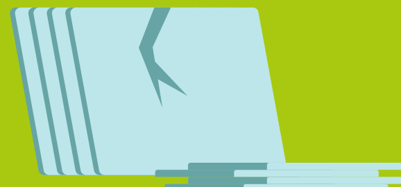
керамическая и иная плитка