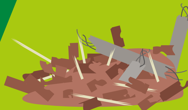
блоки, кирпичи, бой бетона