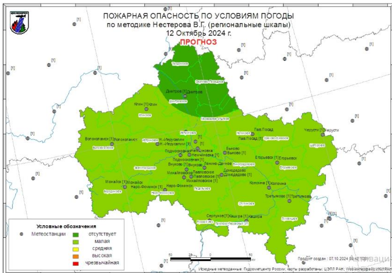
рис.3 2 Прогноз пожарной опасности по условиям погоды по методике Нестерова В.Г.

Прогнозируется вероятность возникновения очагов ландшафтных пожаров на всей территории Московской области (причины: миграция городского населения в рекреационные зоны и на садово-дачные участки, несоблюдение правил пожарной безопасности, а также агроклиматические особенности местности). Малая вероятность возникновения ландшафтных пожаров в городских округах: Богородский, Воскресенск, Егорьевск, Клин, Лосино-Петровский, Луховицы, Наро-Фоминский, Орехово-Зуевский, Павловский Посад, Раменский, Серебряные Пруды, Шатура (рис. 3).