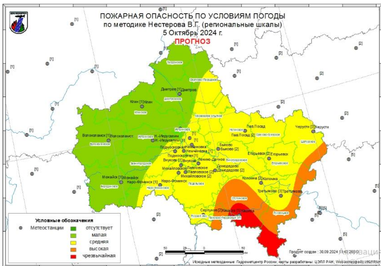
рис.3 2 Прогноз пожарной опасности по условиям погоды по методике Нестерова В.Г.

Прогнозируется вероятность возникновения очагов ландшафтных пожаров на всей территории Московской области (причины: миграция городского населения в рекреационные зоны и на садово-дачные участки, несоблюдение правил пожарной безопасности, а также агроклиматические особенности местности). Высокая вероятность возникновения ландшафтных пожаров в городских округах: Богородский, Воскресенск, Егорьевск, Зарайск, Лосино-Петровский, Луховицы, Наро-Фоминский, Орехово-Зуевский, Павловский Посад, Раменский, Серебряные Пруды, Шатура (рис. 3).