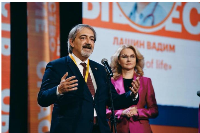
Франческо Рокка , Президент Международной Федерации Обществ Красного Креста и Красного Полумесяца на форум #МЫВМЕСТЕ в Москве

С апреля 2021 года было проведено 26 двусторонних международных встреч с Национальными Обществами и более 15 встреч с дипломатическим представительствами, межправительственными и международными организациями.