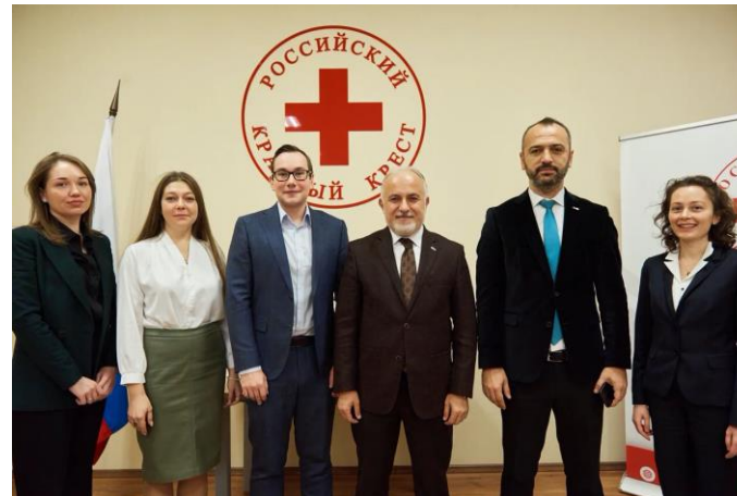
Керем Кынык , вице-Президент МФОККиКП по Европе, Президент Турецкого Красного Полумесяца на встрече в Москве