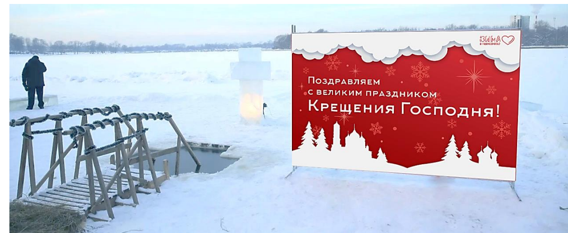
Вариант установки в месте купания